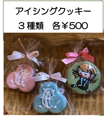
アイシングクッキー 3種類 各¥500