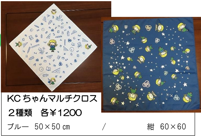
KCちゃんマルチクロス 2種類 各¥1200 ブルー 50×50 cm / 紺 60×60